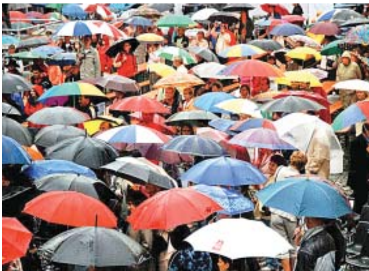
Сколько людей, столько и зонтов