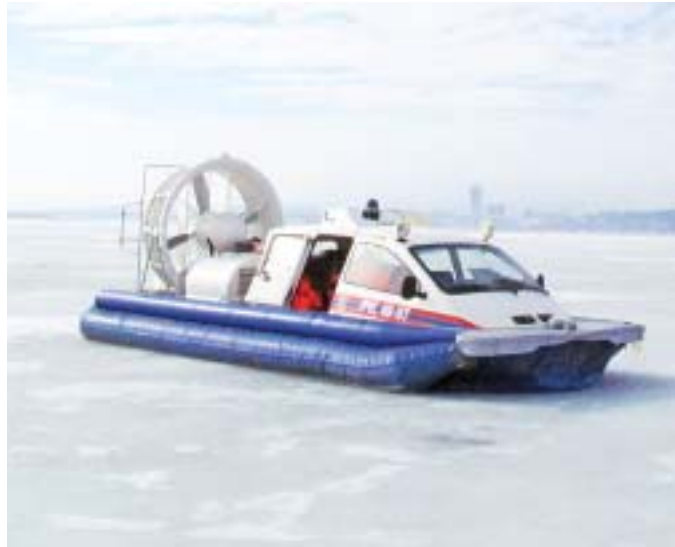
ГИМС готова прийти на помощь незадачливым любителям подводного лова

С наступлением весны работы у него и его коллег прибавилось. Профилактические рейды они проводят постоянно, и, как показывает практика, мера это не лишняя. Отчаянных людей с удочками, готовых сидеть у лунки от рассвета до заката, может быть, и не стало меньше, но ведут они себя осторожнее.