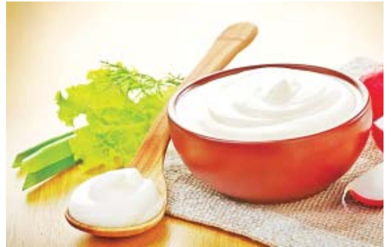
Так выглядит настоящая сметана

Помните, что за названиями «сметанка», «сметаночка» и им подобными скрывается продукт с наполнителями. Идеальная сметана имеет ГОСТ и содержит в составе только сливки и закваску, количество молочнокислых микроорганизмов на конец срока годности в ней не менее 1x10 7 КОЕ/г, а срок хранения не превышает 14 дней.