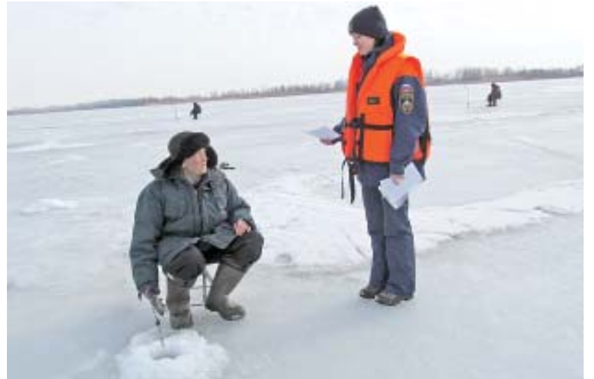
Порой рыбака легче предупредить, чем спасти.

По наблюдениям инспекторов, стремление к здоровому образу жизни проявляется и здесь: мужчины все чаще предпочитают брать с собой на рыбалку не алкогольные напитки, употребление которых может спровоцировать беду, а термосы с горячим чаем или кофе.