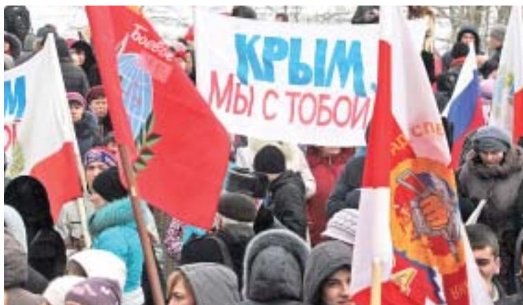
Саратов. Март 2014 года.